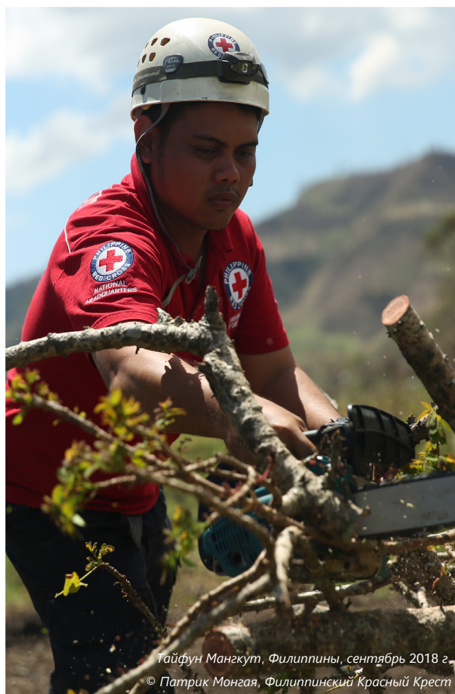
Тайфун Мангкунт, Филиппины, сентябрь 2018 г.

В 2018 году сеть МФОККиКП инвестировала 207 млн. швейцарских франков в проекты в области уменьшения опасности бедствий и адаптации к климатическим изменениям, охватившие 52 миллиона человек в 160 странах. Эти проекты на 72% не причинили ущерба окружающей среде. Удвоение инвестиций позволит Красному Кресту и Красному Полумесяцу удвоить охват и воздействие в области борьбы с изменением климата.