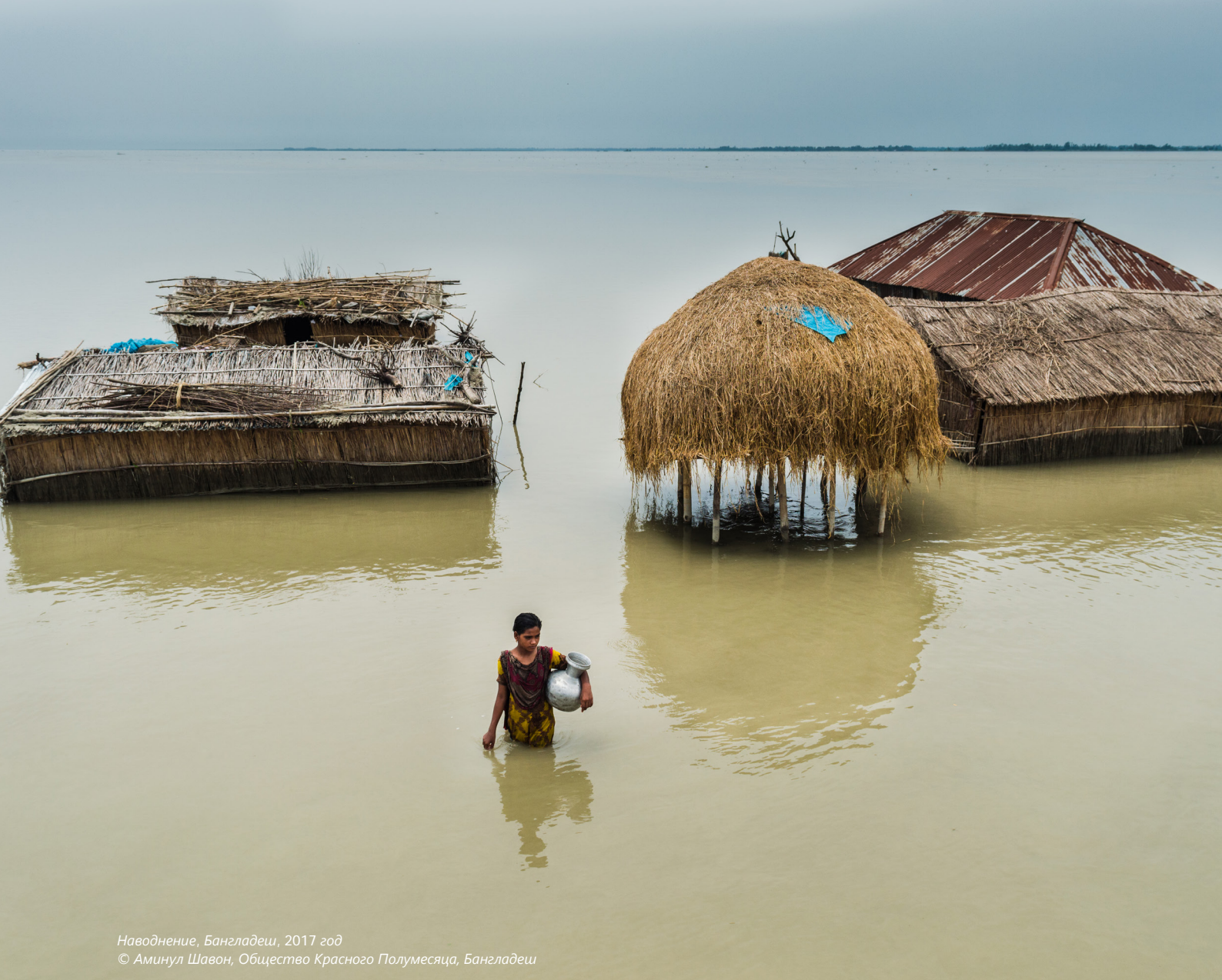
Наводнение, Бангладеш, 2017 год