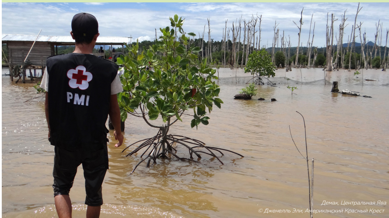
Демак, Центральная Ява